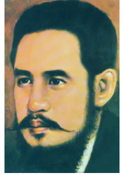
Saw Ba U Gyi

ကရင်လက်နက်ကိုင်တော်လှန်ရေးကြီးဖြစ်ပြီး ကော်သူးလေစစ်ချုပ်ရေး K.M.A ချမှတ်သည့်အခါ လက်နက်ကိုင်တော်လှန်ရေးကာလမည်သည့် အဖွဲ့အစည်းမှမထားရှိဟူ၍ အမိန့်ထုတ်ပြန်ရာ K.N.U ဘေးချိတ်ခံခဲ့ရသည်။ ၁၉၅၃ ခုနှစ် နောက်ပိုင်း K.N.U ကိုပြန်လည်ဖော်ထုတ်သည်။ သို့သော်ပါတီ K.N.U.P-(K.R.C) K.N.U.P ရှေ့ ၁၉၇၁ ခုနှစ်နောက်ပိုင်း K.N.U ကရင်ရှေ့ဆောင်တပ်ဦး၊ အမျိုးသားညီညွတ်ရေးတပ်ပေါင်းစု၊ ကရင်တော်လှန်ရေး နဲ့ အခြေခံကျောထောက်နောက်ခံနှင့် ကော်သူးလေအာဏာပိုင်အဖွဲ့ဖြစ်ပြီး ကြီးလေးသော တာဝန်ကြီးများကို ထမ်းဆောင် ရလေသည်။ ဦးဆောင်တပ်ဦး K.R.C အာဏာပိုင် အဖွဲ့ K.N.U ကို အမျိုးသားအစည်းအရုံး တော်လှန်ရေး ကျောထောက် နောက်ခံရိုးရိုးအဖြစ် ထားရှိသည်။