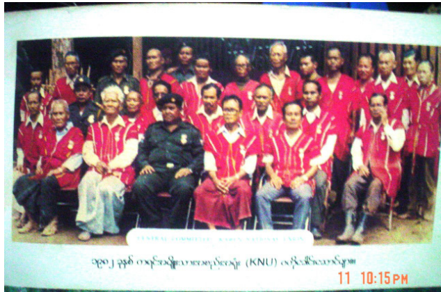
1982 KNU ဗဟိုခေါင်းဆောင်များ

၁၉၇၁ ခုနှစ် နောက်ပိုင်း K.N.U က ရင်ရှေ့ဆောင်တပ်ဦးအမျိုးသားညီညွတ်ရေးတပ်ပေါင်းစု၊ ကရင်တော်လှန်ရေးအခြေခံကျောထောက်နောက်ခံနှင့် ကော်သူးလေ အာဏာပိုင်အဖွဲ့ဖြစ်ပြီး ကြီးလေးသောတာဝန်ကြီးများကို ထမ်းဆောင်ရလေသည်။